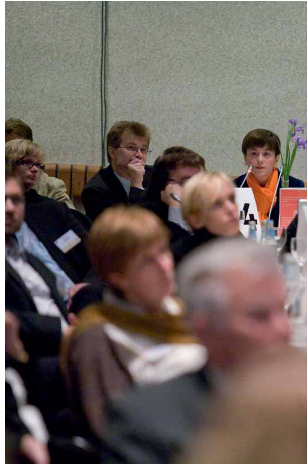
Arutlusingis küsiti, kuidas saaks EL oma haridussüsteemi koondada nii, et tippasemel uuringukeskused ei koonduks vaid paari suuremasse liikmesriiki ja säiliks ELi mitmekultuuriline olemus.

KRASTEV: Ei, peaksin seda pigem reaalspoliitiliseks.