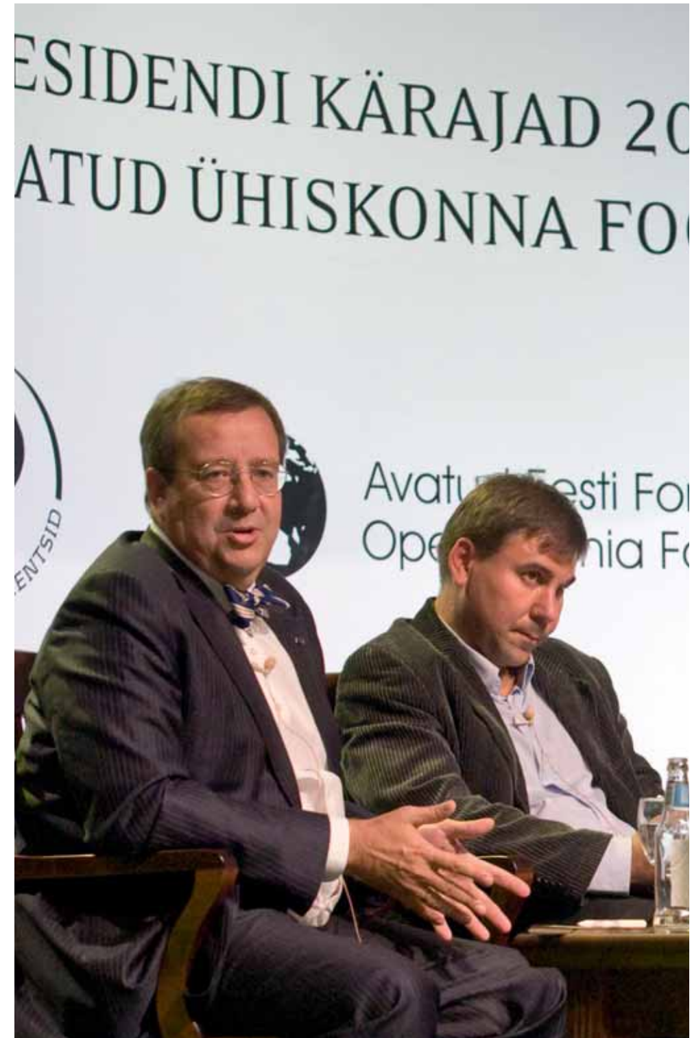
President Toomas Hendrik Ilvese sõnul on ELis kaks valdkonda, mis peale välispoliitika vajavad tublisti lisatööd: need on kaupade ja teenuste vaba liikumine ning energiaturu liberaliseerimine ja ühtse energiapoliitika kujundamine.

Näiteks Bulgaarias moodustab türgi vähemus umbes 10% rahvastikust. Türklased on aga seal elanud juba mitmeid sajandeid, ja see on täiesti erinev probleem kui mitmel pool mujal. Kuid soovmõtlemine, et lõimimise käigus ei pruugi kriise esile kerkida, on üksnes poliitiline trikk.